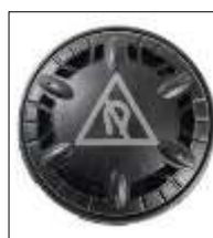
Nemagnetinis reguliuojamas išmetimo vožtuvas