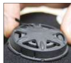
Fiksuotų rankogalių išmetimo vožtuvas