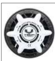
Standartinis reguliuojamas išmetimo vožtuvas

Norėdami patikrinti, ar tinkamai veikia išmetimo vožtuvas, pasukite jį į "OPEN" arba "+" padėtį ir pritūpkite iki kelių. Kostiumas turėtų ištuštėti ir turėtumėte išgirsti orą, išeinantį iš vožtuvo.