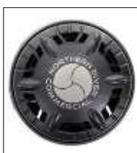
Komerčinis dvigubas grybo formos reguliuojamas išmetimo vožtuvas